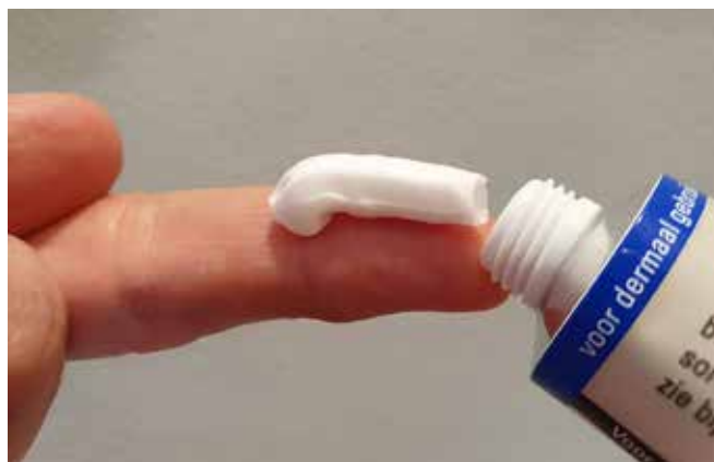
Foto 3. De vingertop eenheid.

Koelen van de huid helpt de jeuk te verlichten. Men kan de