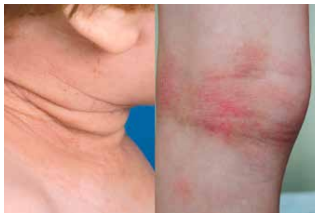
Foto 2. Acuut en chronisch eczeem.

De huid bij eczeem raakt snel geïrriteerd, rood en ontstoken. Om dit te behandelen gebruiken we hormooncrèmes om het eczeem weer tot rust te brengen.