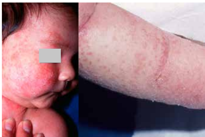
Foto 1. Acuut en chronisch eczeem.